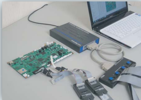
JTAGテストは、従来検査よりも簡単な接続でBGAが搭載された高密度実装基板に対して効率のよい検査を実現できる。

客先からの製造不具合による解析時間が短くなりました。また、発生そのものも今後減っていくと期待しております。