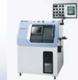
透過型X線検査装置