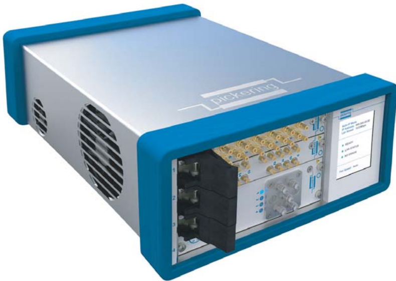
4スロット USB / LXI シャーシ