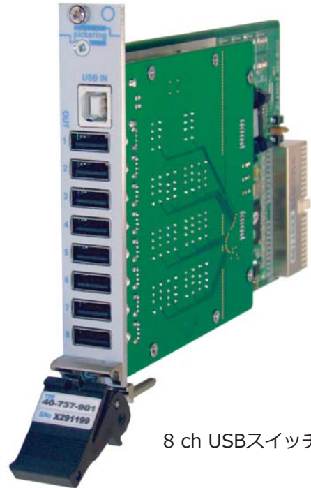
8 ch USBスイッチ モジュール